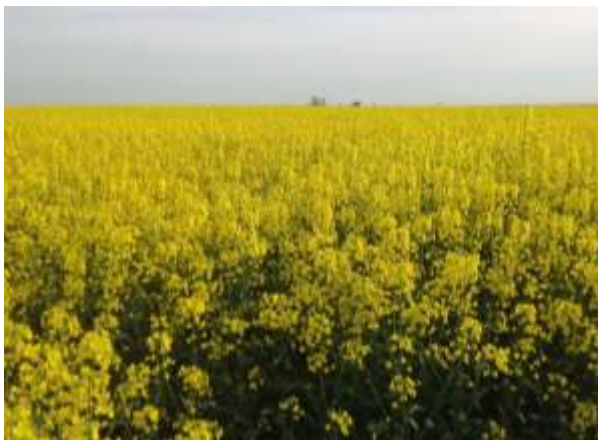
Witalizacja dolistna ozimin