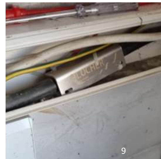
Montaż Plocher e-smog-kątownika