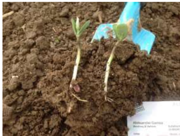
Witalny plan do uprawy soi